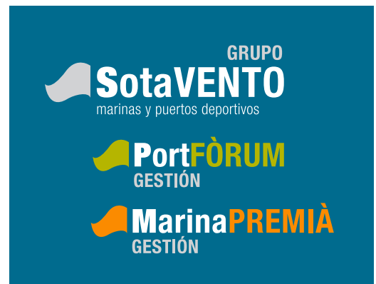
versión en negativo