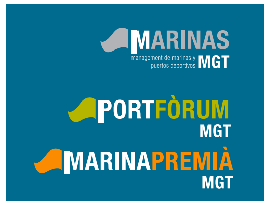
versión en negativo